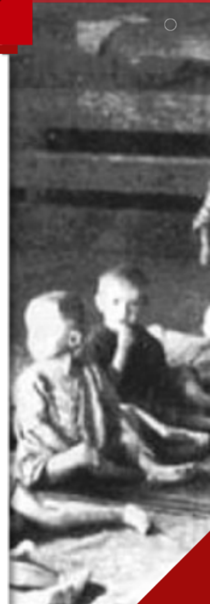
Детский барак концлагеря Саласпилс

● 14 сентября — 24 ноября 1944 г. — Прибалтийская операция по освобождению от немецких войск Эстонии, Латвии и Литвы.