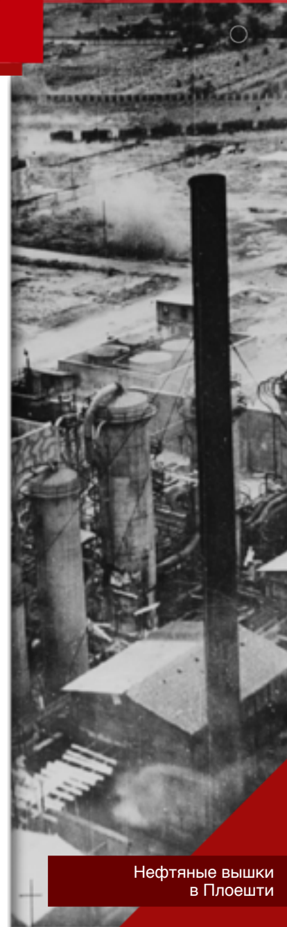
Нефтяные вышки в Плоешти