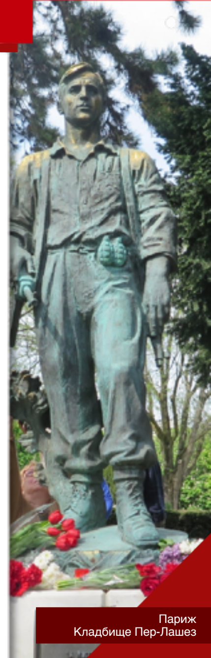
Париж Кладбище Пер-Лашез