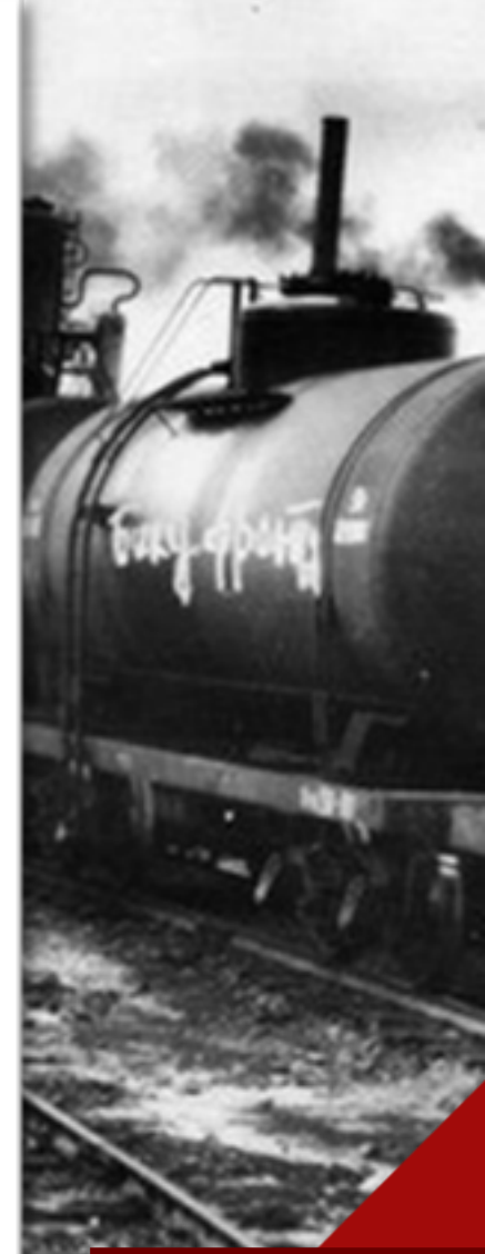
Поезд с горючим

Маршал Советского Союза Георгий Жуков писал: «Нефтяники Баку давали фронту и стране столько горячего, сколько нужно было для защиты нашего Отечества, для быстрой победы над врагом».