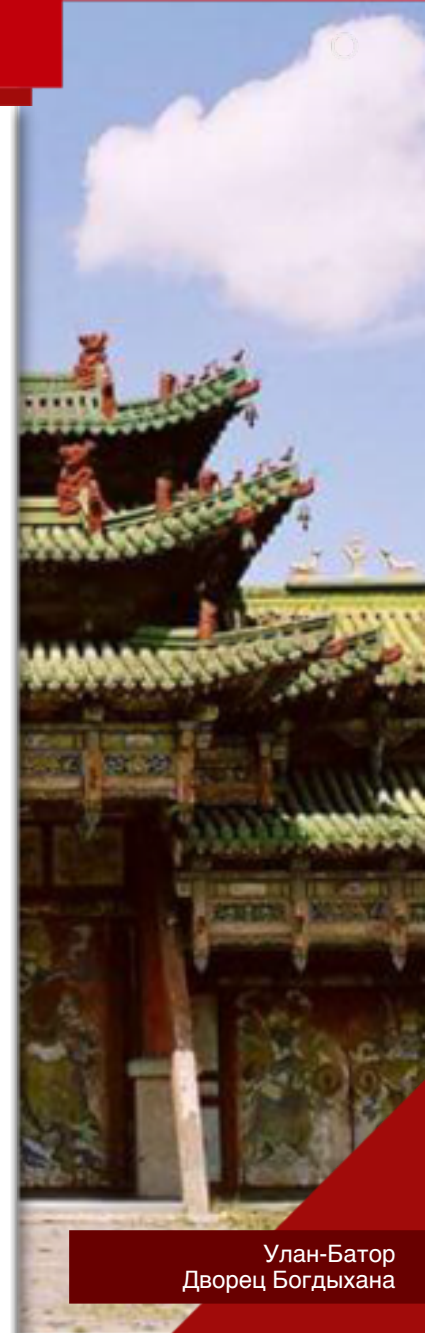
Улан-Батор Дворец Богдыхана