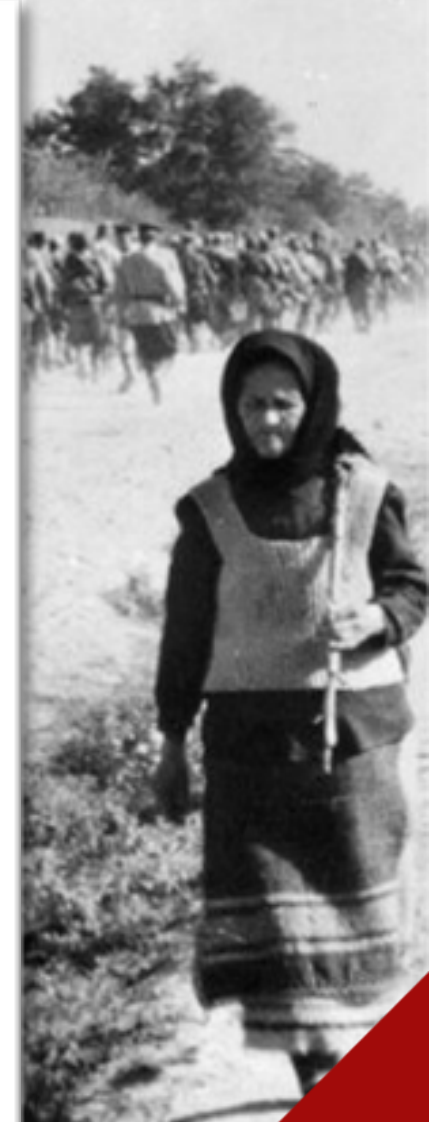
Молдавия Яско-Кишиневская операция

● 20–29 августа 1944 г. — Яско-Кишиневская операция. 26 августа — освобождение Молдавии от румынской оккупации.