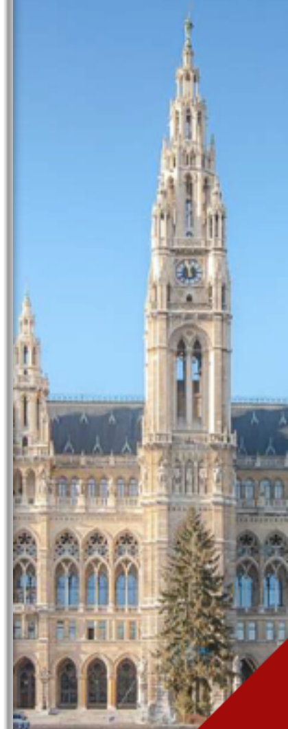
Вена Венская ратуша