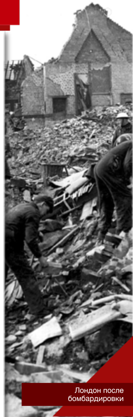
Лондон после бомбардировки