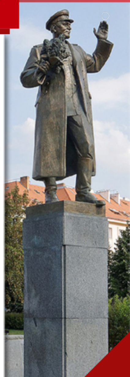
Прага Памятник И. С. Коневу

6 мая 1945 — 11 мая 1945 — Пражская операция, последняя операция советских войск в Европе в годы Второй мировой войны.