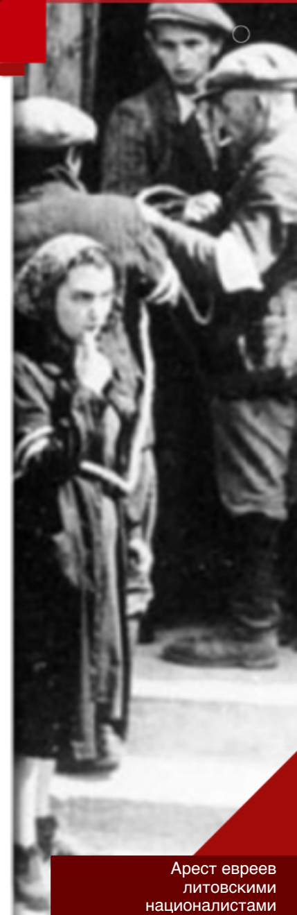
Арест евреев литовскими националистами