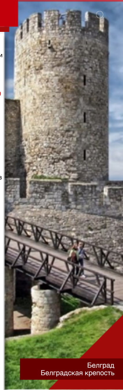
Белград Белградская крепость

19 июня 1945 г. — учреждена медаль за «Освобождение Белграда».