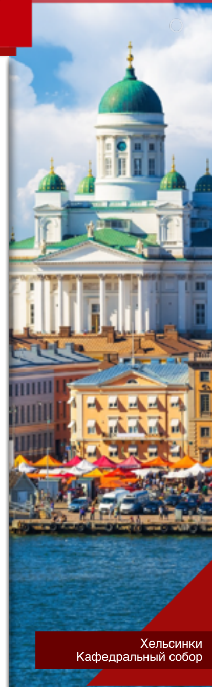
Хельсинки Кафедральный собор

25 апреля 1945 г. — немецкие войска полностью изгнаны с финской территории.