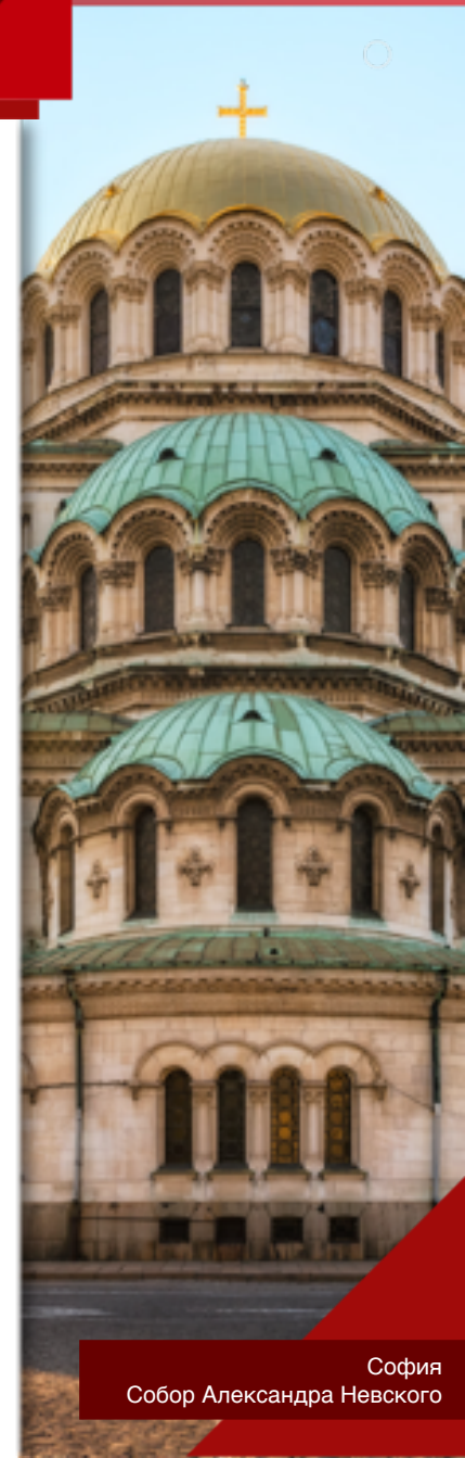
София Собор Александра Невского

17 апреля 1944 г. — «черная пятница»: 350 бомбардировщиков и 100 истребителей союзников сбросили на столицу Болгарии 2 500 бомб. Погибли 128 человек и 69 были ранены.