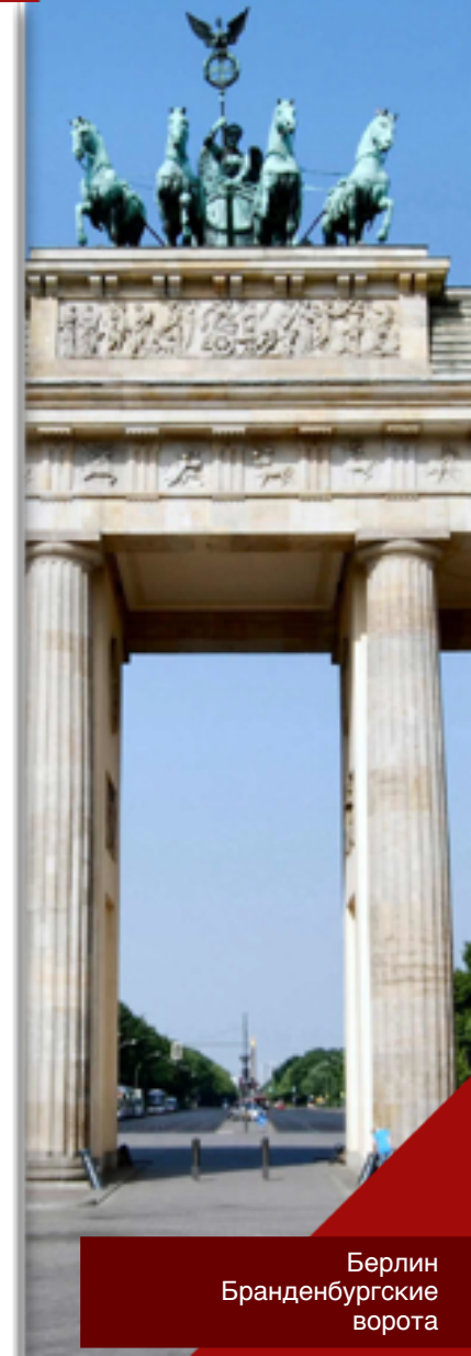
Берлин Бранденбургские ворота

24 июня 1945 г. — в Москве состоялся Парад Победы, в ходе которого к подножию Кремлевской стены были брошены военные знамена поверженной гитлеровской Германии.