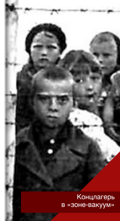
Концлагерь в «зоне-вакуум»