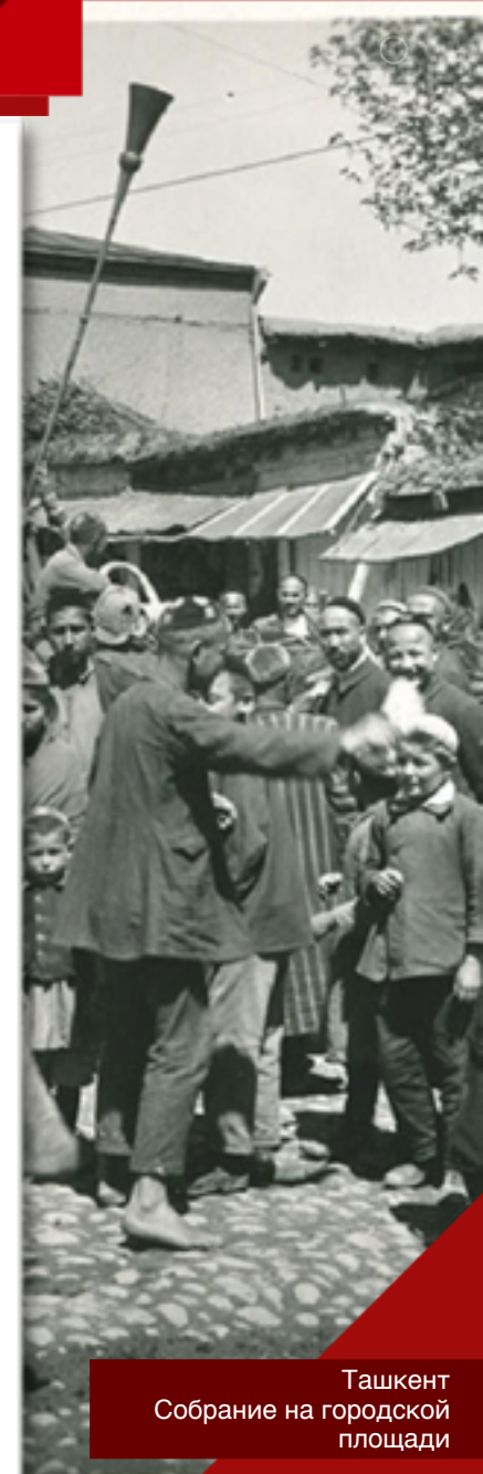
Ташкент Собрание на городской площади

Боевыми орденами и медалями были награждены 78 000 воинов, а 112 туркмен получили звание Героя Советского Союза.